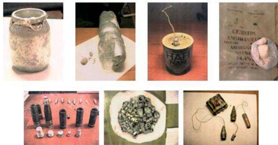
Фотографии взрывных устройств и их компонентов, изготовленных из штатных боеприпасов, аммиачной селитры и алюминиевой пудры, изъятых в процессе оперативно-розыскных мероприятий оперработниками ФСБ России

ПОМНИТЕ: внешний вид предмета может скрывать его настоящее назначение. В качестве камуфляжа для взрывных устройств используются обычные бытовые предметы: сумки, пакеты, свертки, коробки, игрушки и т.п.